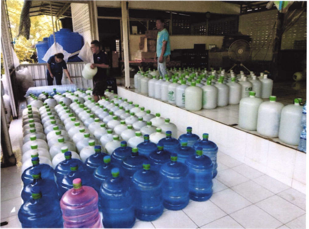
เก็บตัวอย่างส่งตรวจคุณภาพน้ำดื่ม/น้ำแข็งเพื่อการบริโภค